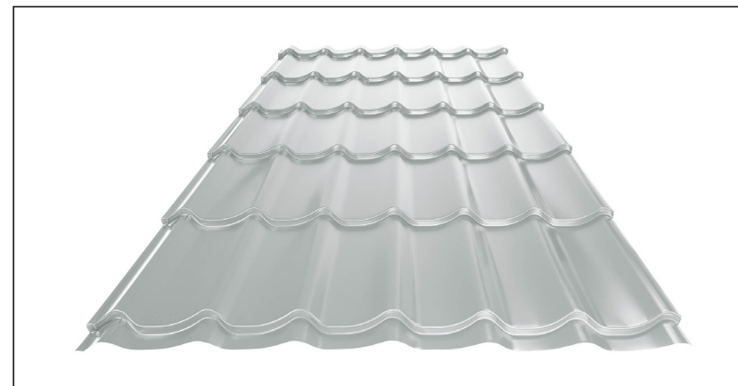
L – OPTIMALNA DUŽINA POKRIVAČA ZA MODUL 350 mm