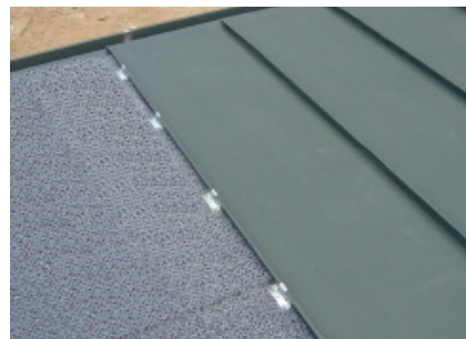
Primer upotrebe strukturirane PROSTIRKE 8 mm ispod krovnog pokrivača KJG FALZ.

Poliamidni strukturirani sloj za razdvajanje debljine 8 mm.