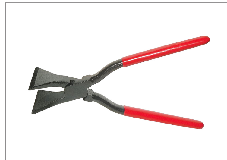
Ugljenični čelik C45