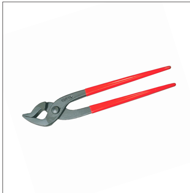
Ugljenični čelik C45