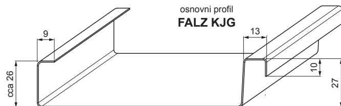
osnovni profil FALZ KJG