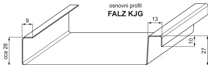
osnovni profil FALZ KJG