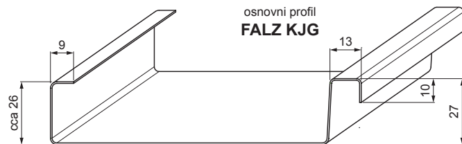
osnovni profil FALZ KJG