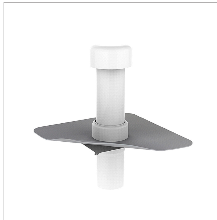
B PVC – Bela – RAL 9010