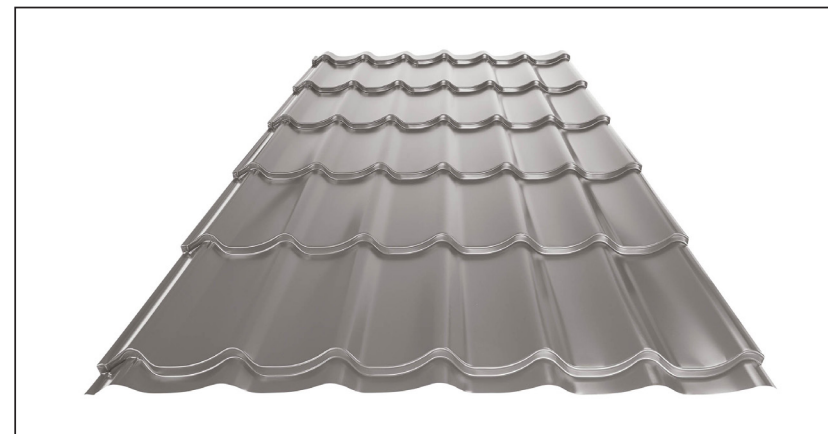
L – OPTIMALNA DUŽINA POKRIVAČA ZA MODUL 350 mm