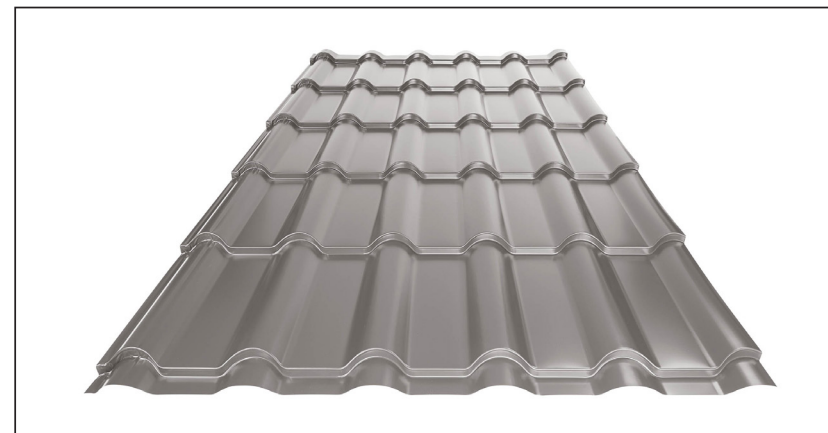
L – OPTIMALNA DUŽINA POKRIVAČA ZA MODUL 350 mm